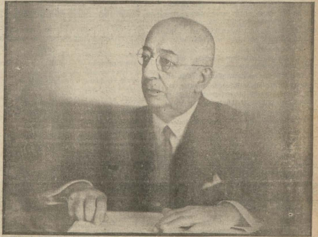
Başvekilimiz Doktor Refik Saydam

Başvekilin dün Partide verdiği izahat alkışlarla tasvib edildi